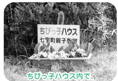
ちびっ子ハウス内で、七宗町親子教室の活動しています。