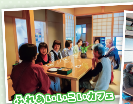
ふれあいこいカフェ

各地でふれあいサロンを開催しています。本郷地区ではいこいの館を利用して、毎月第2月曜日にお抹茶を楽しみながら、ふれあいこいカフェを実施しています。また杉洞地区でも公民館を利用して毎月第4金曜日におしゃべりやレクリエーションを実施し楽しい時間を過ごしています。