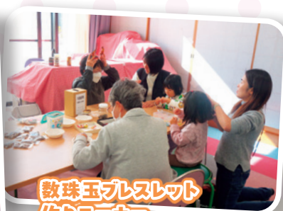
数珠玉プレスレット 作りコーナー