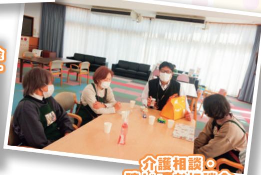
介護相談・ 障がい者相談会