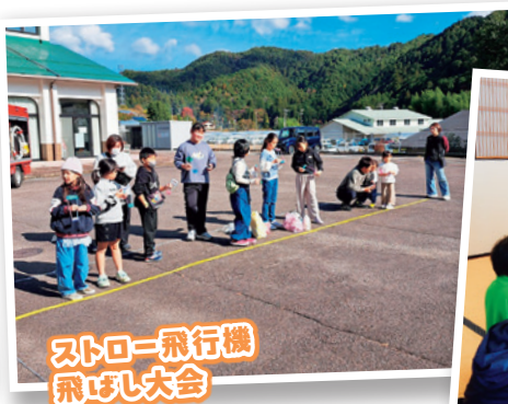
ストロー飛行機 飛ばし大会