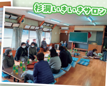
杉洞いきいきサロン