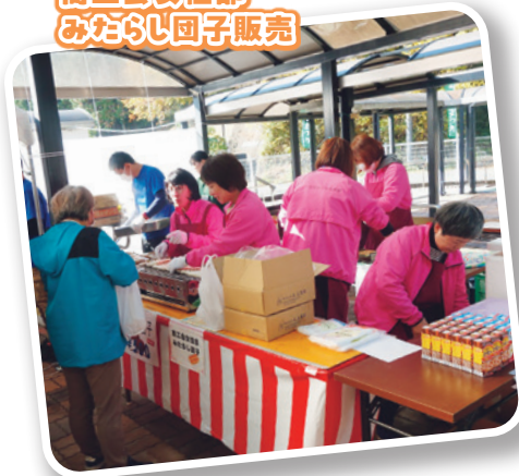
商工会女性部 みならし団子販売