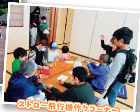
ストロー飛行機作りコーナー