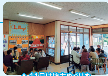
▲11月は坊主めぐりを 行いました。

サンホーム七宗で、毎月自由参加のサロンを開催しています。 小物作りやレクリエーションで気分転換をし、おしゃべりを 交えて楽しいひとときを過ごしませんか？尚、申込みはすべて 一回ごとです。町内どこからでも送迎します。その他ご不明な 点がございましたらお気軽にお問合せください。