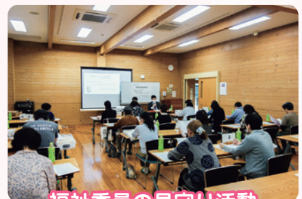
福祉委員の見守り活動