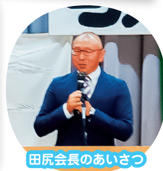
田尻会長のあいさつ