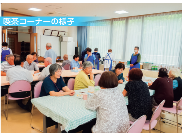
喫茶コーナーの様子