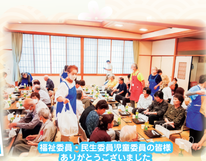
福祉委員・民生委員児童委員の皆様 ありがとうございました