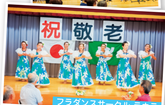
フラダンスサークル ラウラ