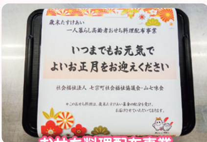
おせち料理配布事業