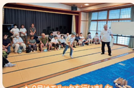
▲9月はモルックを行いました。