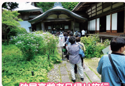
独居高齢者日帰り旅行