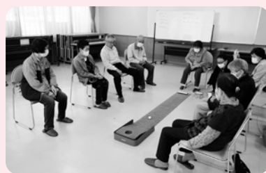
△パターゴルフをしました