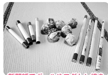
新聞紙でボールやコグトレ棒を子どもたちと作って、遊びました。