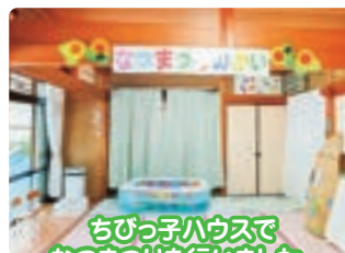
ちびっこハウスで なつまつりを行いました。