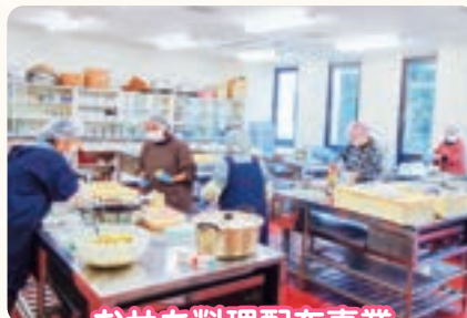
おせち料理配布事業