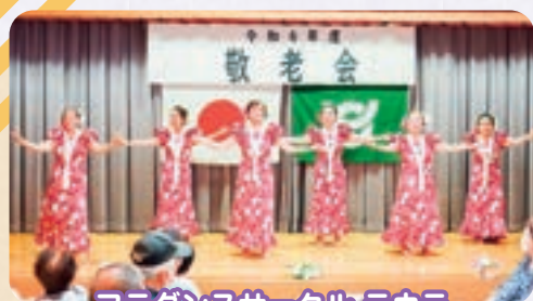
フラダンスサークル ラウラ