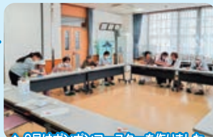
▲9月はボンボンコースターを作りました。

サンホーム七宗で、毎月自由参加のサロンを開催しています。 小物作りやレクリエーションで気分転換をし、おしゃべりを 交えて楽しいひとときを過ごしませんか？尚、申込みはすべて 一回ごとです。町内どこからでも送迎します。その他ご不明な 点がございましたらお気軽にお問合せください。