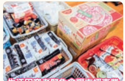
生活困窮者緊急食糧支援事業