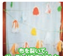
布を裂いて、 ガーランドを作りました。