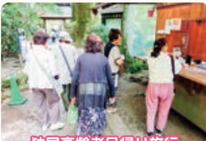
独居高齢者日帰り旅行