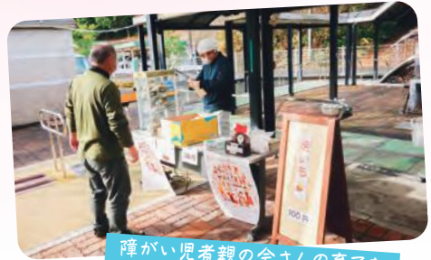
障がい児者親の会さんの育てた サツマイモを使った焼きも