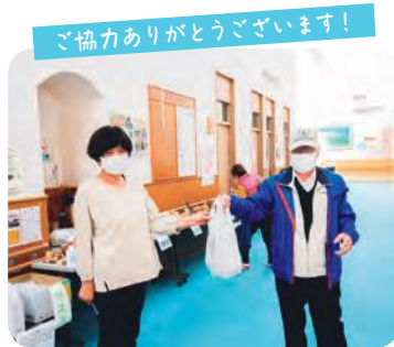
ご協力ありがとうございます!