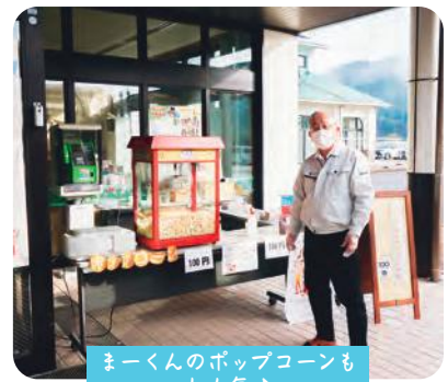
まーくんのポップコーンも 大人気♪