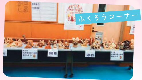
ふくろうコーナー