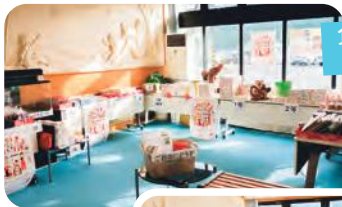
100円募金くじ! たくさんの 景品を用意しました!