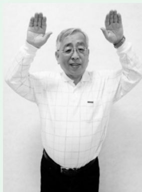
③「きつね」顔の横で、両手を使って、きつねの耳を作ります。