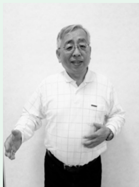
②「ためき」お腹の前で、両手を交互に、お腹を叩きます。