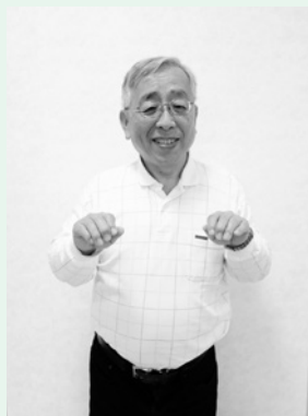
④「ねこ」胸の前で、両手を使って、ねこの手招きをします。