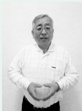
①「こぶた」お腹の前で、両手を使って、楕円形を作ります。